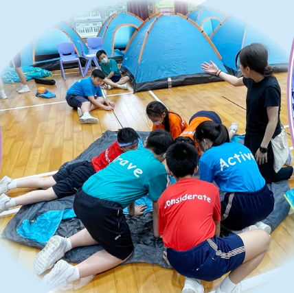
同學努力地搭建自己的「家」！