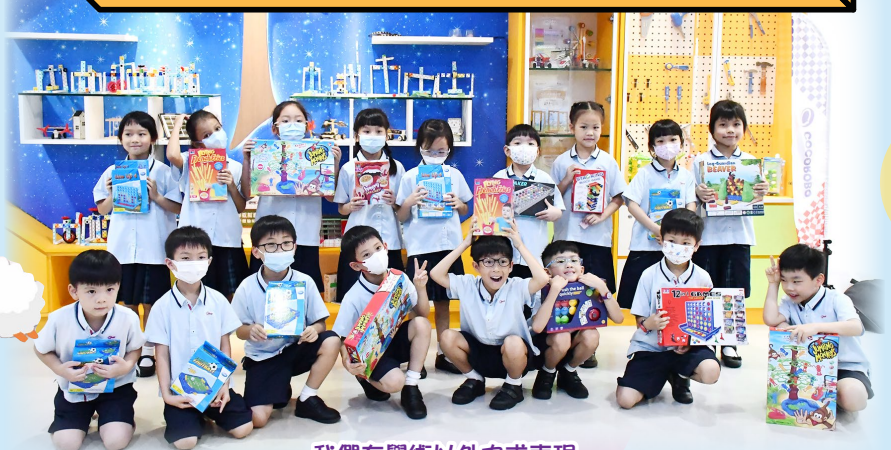
我們在學術以外力求表現