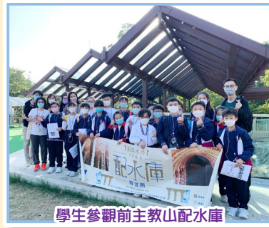
學生參觀前主教山配水庫