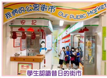
學生認識昔日的街市