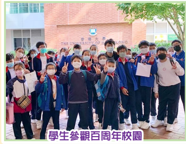
學生參觀百周年校園