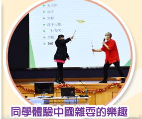
同學體驗中國謎語的樂趣