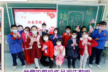
我們的剪紙作品很生動呢