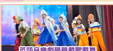
英語音樂劇學員載歌載舞