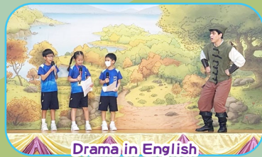
Drama in English