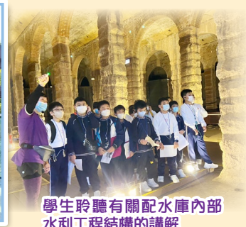
學生聆聽有關配水庫內部水利工程結構的講解