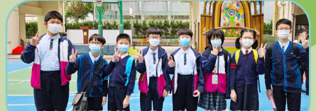
五、六年級同學參加「全港小學數學挑戰賽」