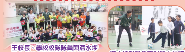
王校長、學校校隊隊員與深水埗體育會足球隊隊員一同合照