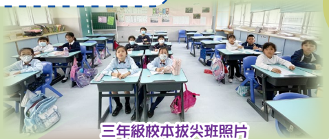
三年級校本拔尖班照片

校本數學拔尖班培養本校數學科尖子的計算技巧、數字感、空間感和邏輯推理能力，並提供各項數學比賽的培訓，讓學生能與不同數學精英互相切磋。