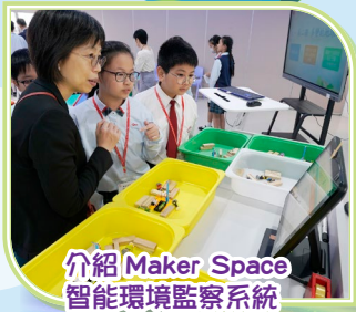
介紹 Maker Space 智能環境監察系統