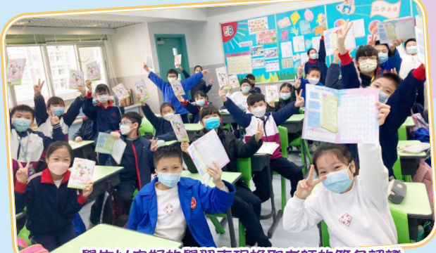
學生以良好的學習表現換取老師的簽名認證