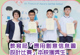
教育局「應用創意信息圖設計比賽」本校獲獎生

本校三位六年級同學於教育局舉辦的「應用創意信息圖設計比賽」獲得佳績。同學參與比賽的過程中，需要搜集數學應用於建築上的資料，再運用創意將資料轉化為圖像，設計一幅獨一無二的信息圖。透過繪畫信息圖，讓學生明白數學在生活不同範疇的正面影響。