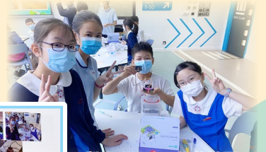
學生在深水埗區地圖展示其作品