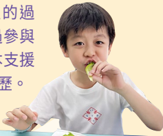
學生試食其種植的生菜

學生透過體驗水耕及土耕種植的過程，認識兩者的優點與缺點，並通過參與現代農夫主持的講座及香港大學校本支援的專題研習，體驗與別不同的學習經歷。