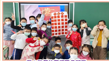
看！我們的百福圖多好看