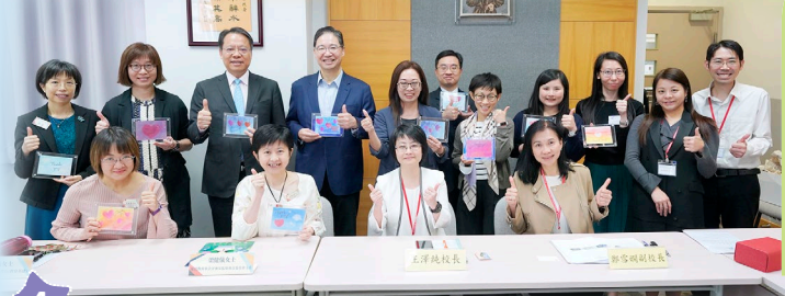
與教育局嘉賓合照