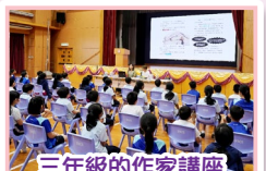
三年級的作家講座