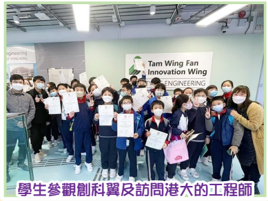
學生參觀創科翼及訪問港大的工程師