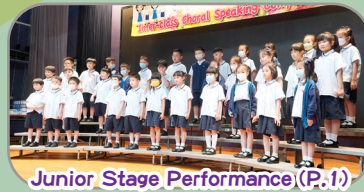
Junior Stage Performance (P.1)