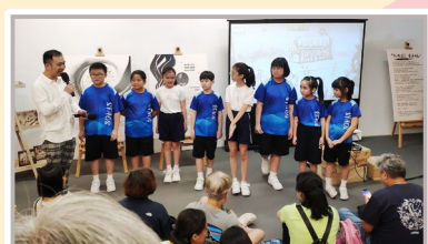
同學分享學習沙畫的樂趣