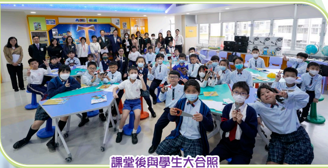
課堂後與學生大合照