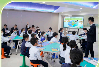
學生在 Maker Space 學習的情況