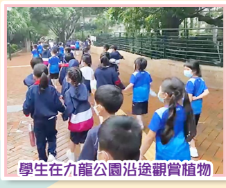
學生在九龍公園沿途觀賞植物