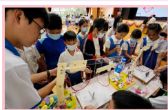
學生正參與中學 STEM 攤位，培養科探精神