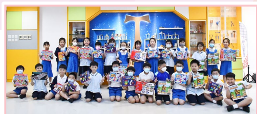
「愛德星途」獲獎學生換領禮物後大合照