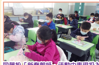
同學於「新春剪紙」活動中表現投入