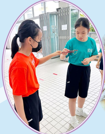
全神貫注，完成任務！