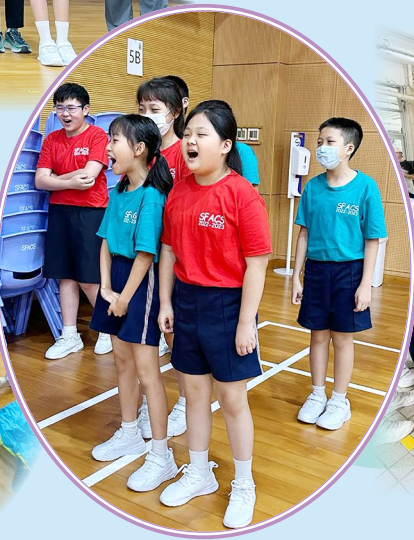
同學大叫口號，為自己組別打氣！