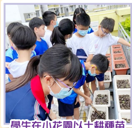
學生在小花園以土耕種苗