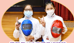
同學們十分享受是次體驗