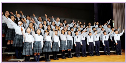
三、四年級學生於「第七十五屆學校朗誦節普通話集誦比賽」獲得季军