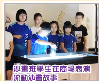
沙畫班學生在商場表演流動沙畫故事