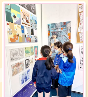
同學們互相討論展覽中的展品，認真學習。