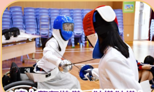
穿上整套裝備，似模似樣！