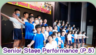
Senior Stage Performance (P.5)