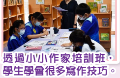
透過小小作家培訓班，學生學會很多寫作技巧。