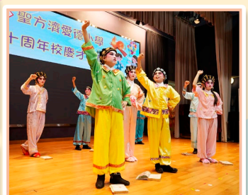
粵劇班學員功架十足