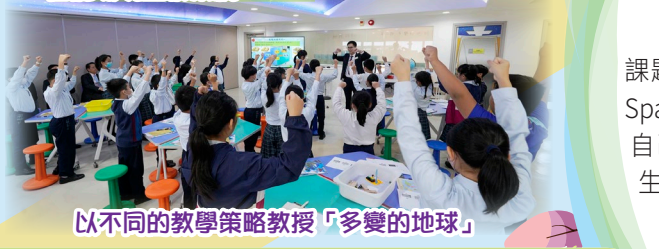
以不同的教學策略教授「多變的地球」